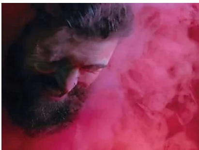
5 libri da leggere a ottobre 2018 ( https://www.panorama.it/cultura/libri/5-libri-da-leggere-ottobre-2018/?obOrigUrl=true )