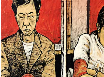
5 libri da leggere ad agosto 2018 ( https://www.panorama.it/cultura/libri/5-libri-da-leggere-ad-agosto-2018/?obOrigUrl=true )

Scelti per te gli-spaesati gli-spaesati gli-spaesati