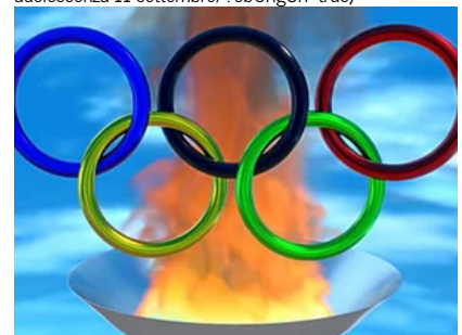
Libri novità: i titoli più belli dedicati allo sport ( https://www.panorama.it/cultura/libri/libri-novita-titoli-piu-belli-dedicati-allo-sport/?obOrigUrl=true ) ( https://www.iubenda.com/privacy-policy/8108345/cookie-policy )