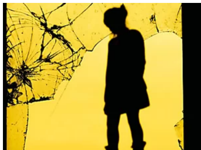
Libri novità: i gialli internazionali da leggere ( https://www.panorama.it/cultura/libri/libri-novita-gialli-internazionali-da-leggere/?obOrigUrl=true ) ( https://www.outbrain.com/what-is/default/it )