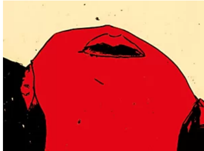
5 libri da leggere a luglio 2018 ( https://www.panorama.it/cultura/libri/5-libri-da-leggere-luglio-2018/?obOrigUrl=true )