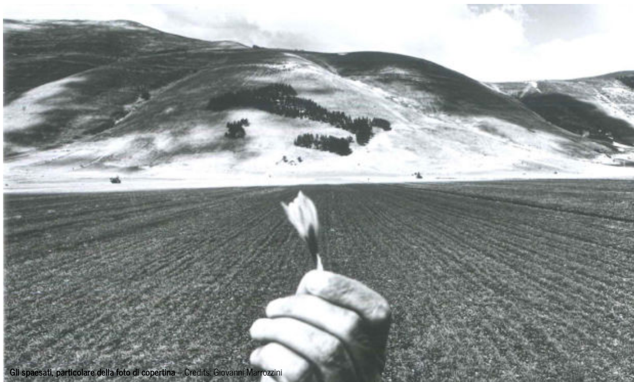
Gli spaesati, particolare della foto di copertina - Credits: Giovanni Marrozzini

Reportage commosso dalle zone del terremoto del centro Italia